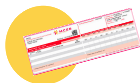
● Votre carte de complémentaire santé

Ce livret vous présente de façon chronologique toutes les étapes du parcours de soins au sein de notre établissement. Nous vous remercions d'en prendre connaissance et de le conserver avec vous. Vous trouverez à la fin de ce livret un rabat au sein duquel vous pourrez intégrer les documents qui vous sont remis. Vous trouverez d'ores et déjà intégrés à ce livret en annexe :