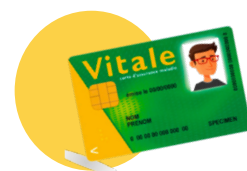
● Votre carte vitale